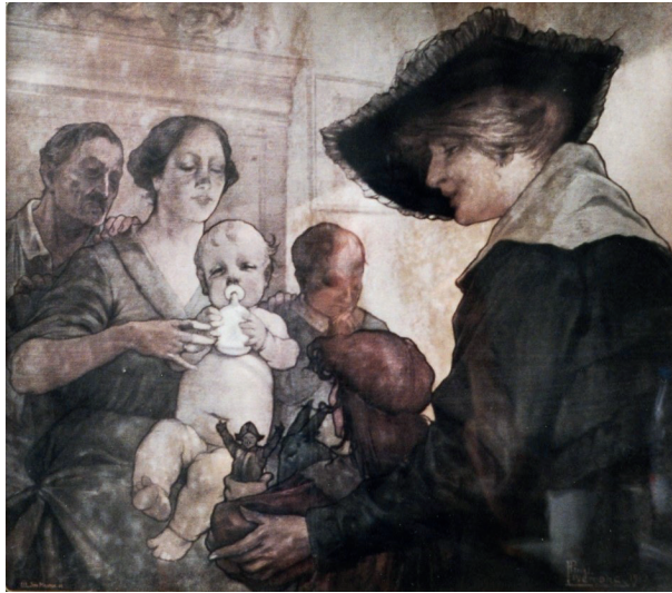
La goutte de lait , 1917, Privat Antoine Théodore Livemont