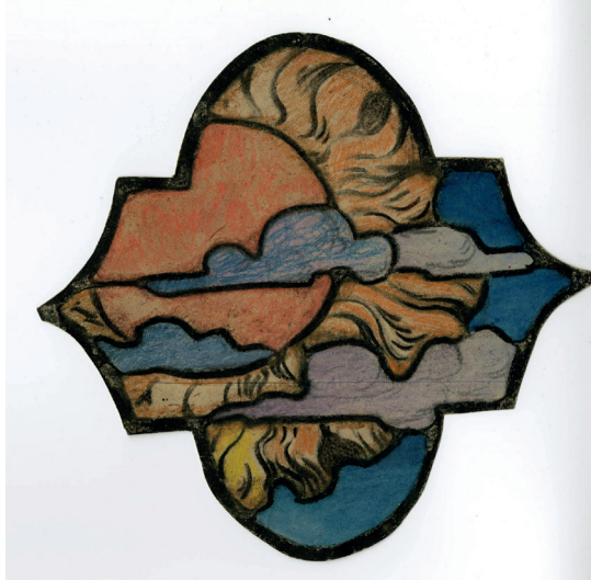
Le feu – projet de vitrail, 1920, Henri Quittelier