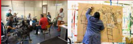
Exposición fotográfica de la asociación belga Créahm.

Lugar: Rejas del Castillo de la Real Fuerza