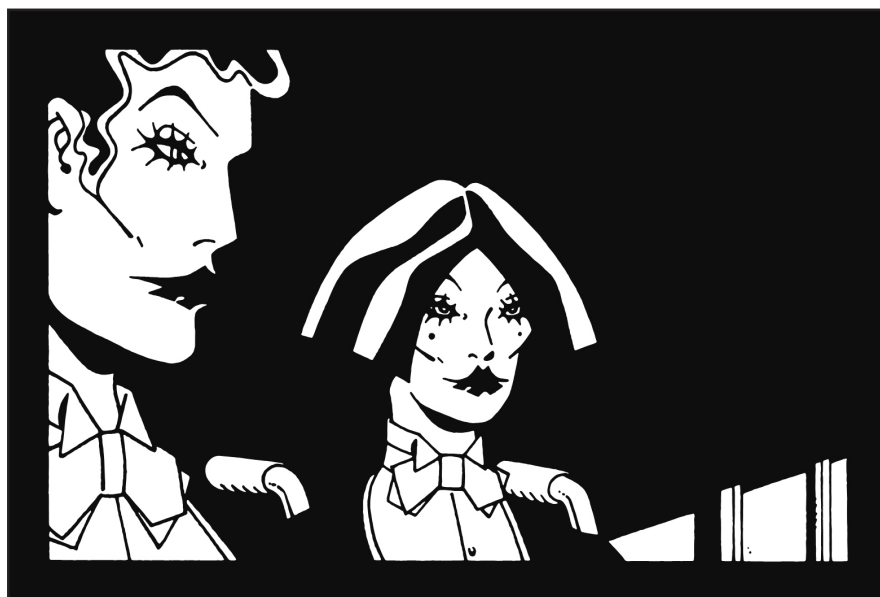
EVA , Didier Comès

L'Arbre-Cœur , histoire suivante de Comès, débute en 1987 dans (A Suivre), après presque trois ans d'absence. Le personnage, une fois de plus féminin, ne laissera pas non plus indifférent derrière son apparente froideur.